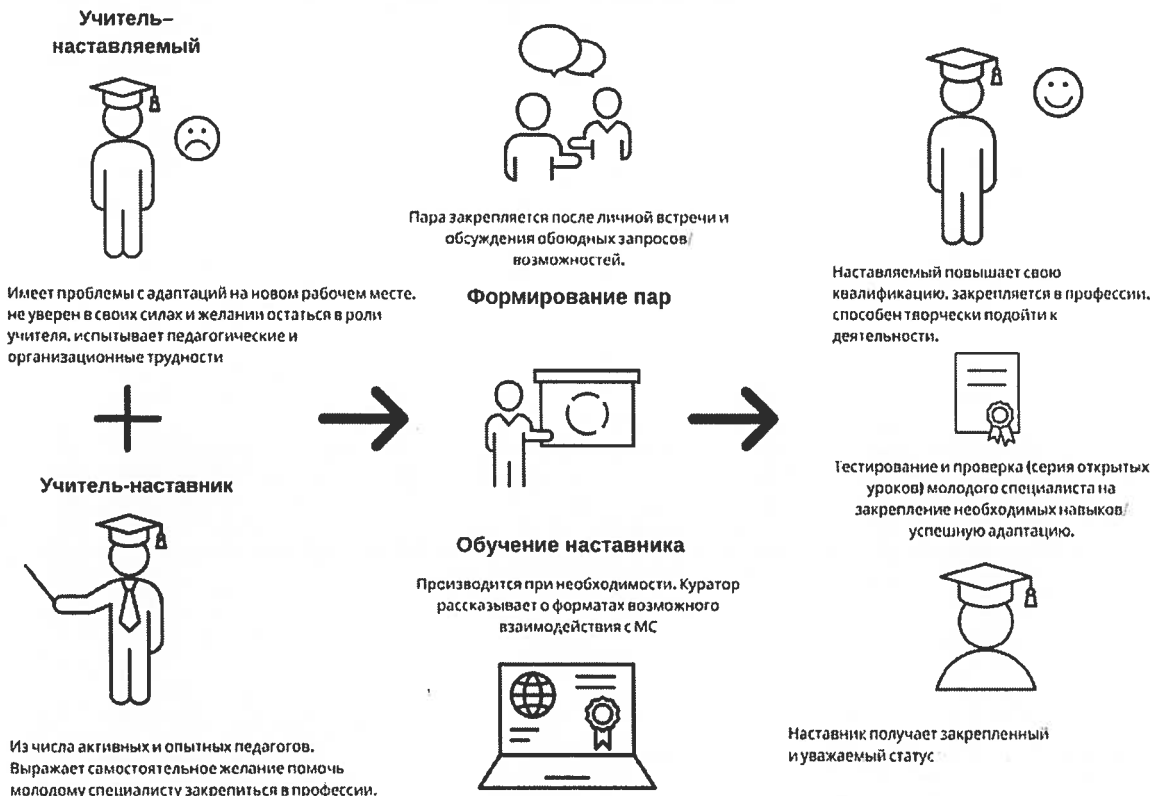
Рисунок 1. Графическое представление взаимодействия по форме «учитель – учитель»