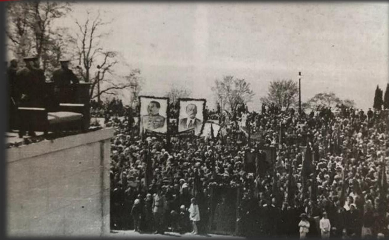
Митинг 9 мая 1945г возле Зимнего театра